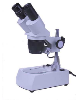
MC-1 (вариант 2С) – микроскоп стереоскопический

ДД 3900-1 – устройство предназначено для управления форсунками Bosch CR, Denso CR и Delphi CR, пьезо для форсунок Siemens. 1-канальный