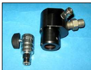
AZ0309-09 - АДАПТЕР ДЛЯ ФОРСУНОК С БОКОВЫМ ПОДВОДОМ ТОПЛИВА ДЛЯ VOLVO – DEUTZ – RENAULT PREMIUM

Второго поколения С насадкой Диаметр 28мм