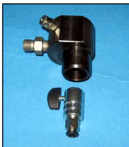
AZ0309-02 - АДАПТЕР ДЛЯ ФОРСУНОК CR MAN Для Man 646, диаметр 29мм